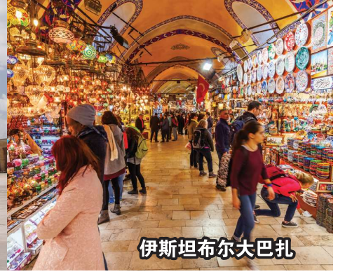
伊斯坦布尔大巴扎