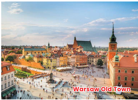
Warsaw Old Town