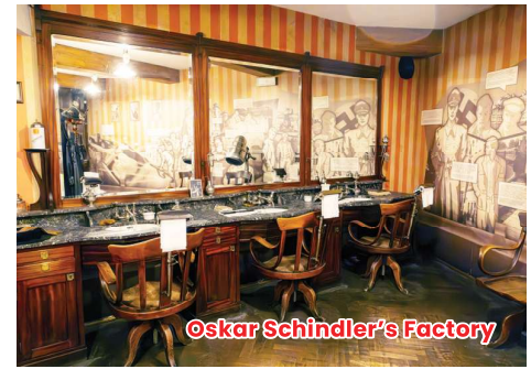
Oskar Schindler's Factory