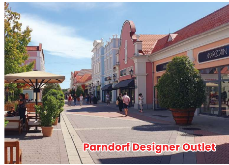
Parndorf Designer Outlet