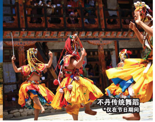
不丹传统舞蹈 仅在节日期间