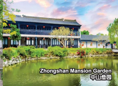
Zhongshan Mansion Garden 中山詹園