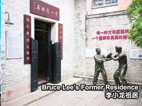
Bruce Lee's Former Residence 李小龍祖居