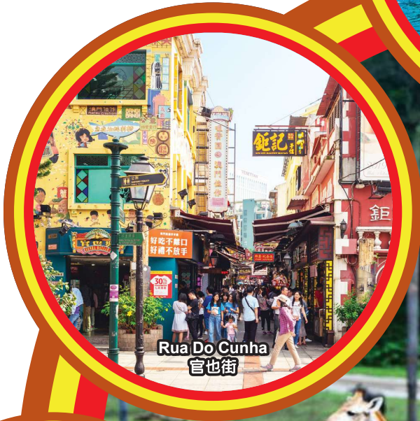
Rua Do Cunha 官也街