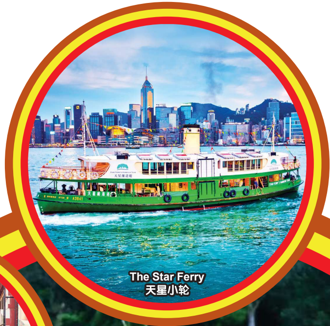
The Star Ferry 天星小轮