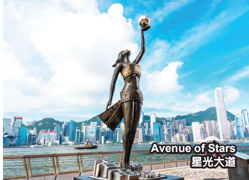
Avenue of Stars 星光大道