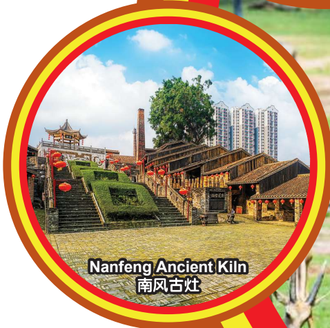
Nanfeng Ancient Kiln 南风古灶