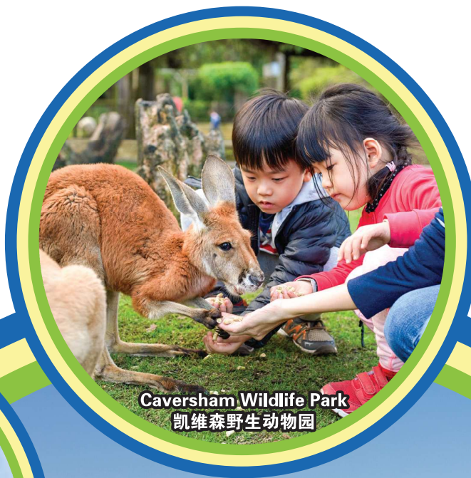
Caversham Wildlife Park 凯维森野生动物园