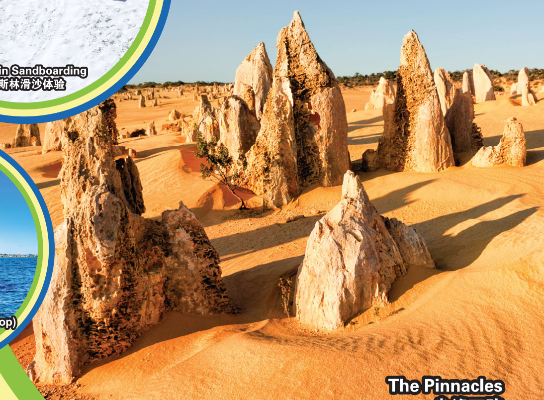
The Pinnacles 尖峰石阵