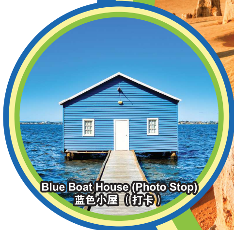
Blue Boat House (Photo Stop) 蓝色小屋 (打卡)