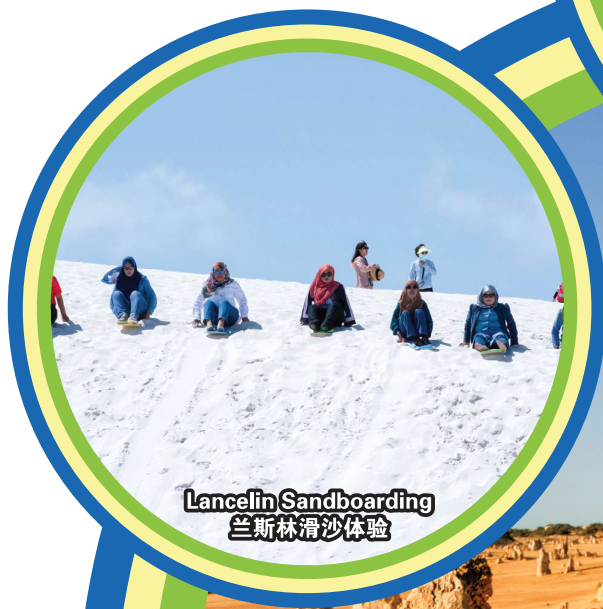
Lancelin Sandboarding 兰斯林滑沙体验