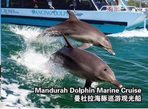
Mandurah Dolphin Marine Cruise 曼杜拉海豚巡游观光船