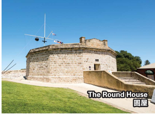
The Round House 圆屋