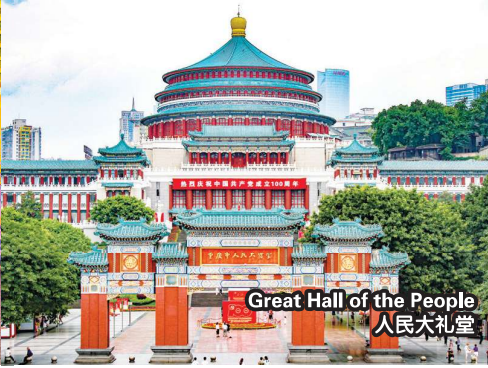
Great Hall of the People 人民大礼堂