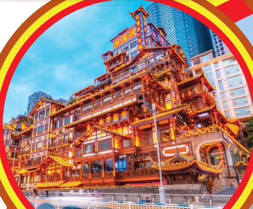
Hongya Cave Scenic Area 洪崖洞风景区