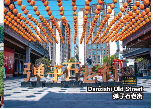
Danzishi Old Street 弹子石老街