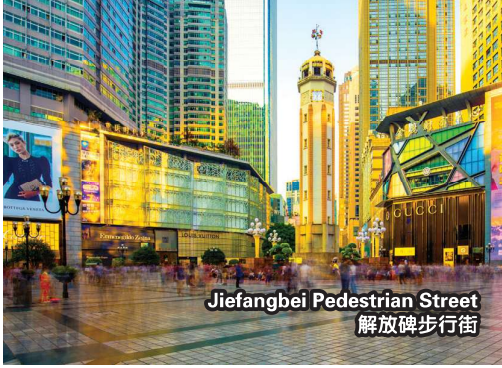
Jiefangbei Pedestrian Street 解放碑步行街