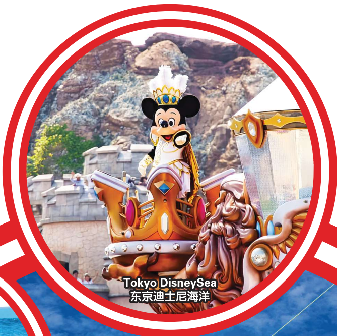
Tokyo DisneySea 东京迪士尼海洋