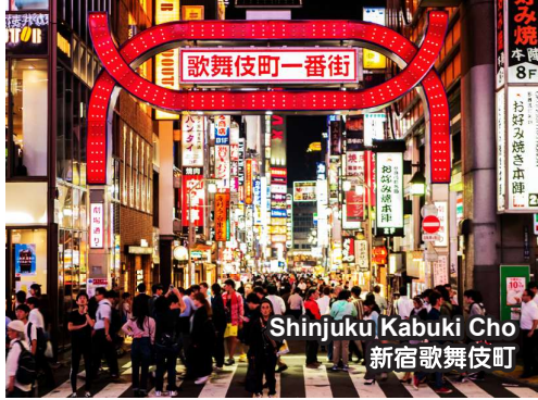
Shinjuku Kabuki Cho 新宿歌舞伎町