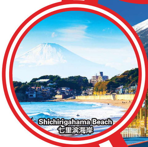
Shichirigahama Beach 七里滨海岸