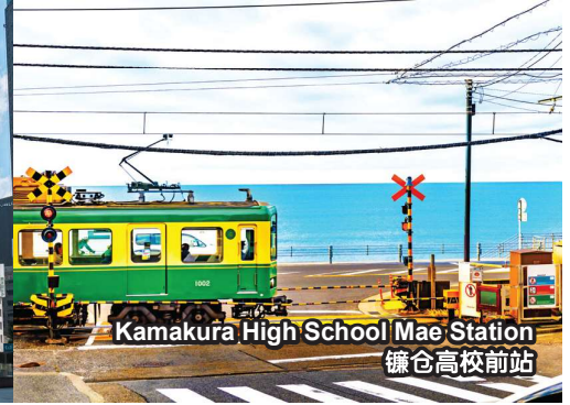
Kamakura High School Mae Station 镰仓高校前站