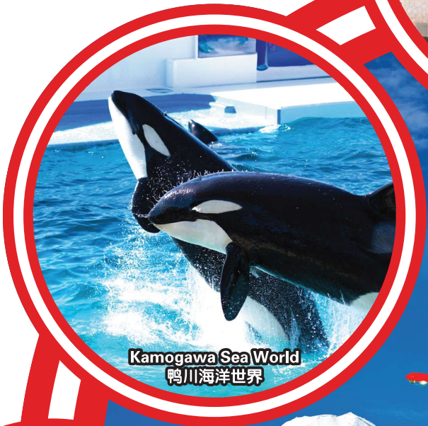
Kamogawa Sea World 鸭川海洋世界