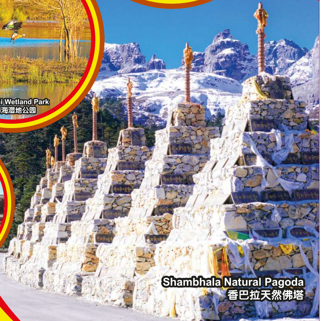
Shambhala Natural Pagoda 香巴拉天然佛塔

行程次序，以当地旅社安排为准。 Sequences of Itinerary are subject to local arrangement.