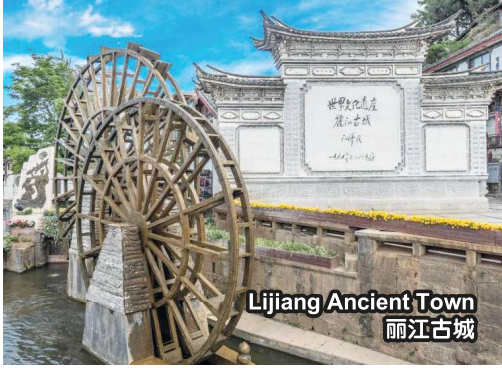
Lijiang Ancient Town 丽江古城