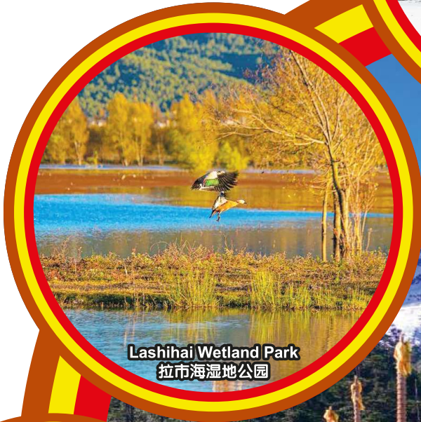
Lashihai Wetland Park 拉市海湿地公园