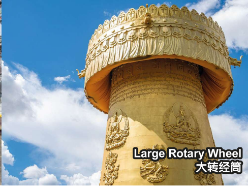
Large Rotary Wheel 大转经筒