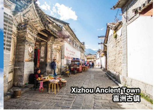
Xizhou Ancient Town 喜洲古镇