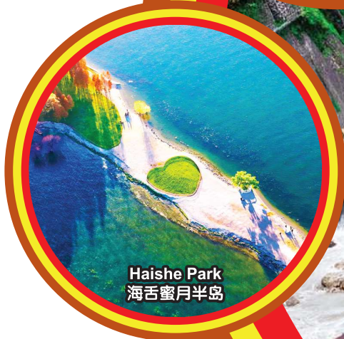
Haishe Park 海舌蜜月半岛