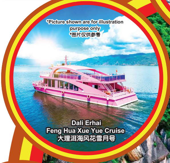
Dali Erhai Feng Hua Xue Yue Cruise 大理洱海风花雪月号

*Picture shown are for illustration purpose only *图片仅供参考