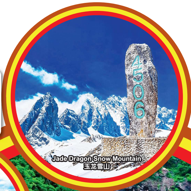
Jade Dragon Snow Mountain 玉龙雪山

*Picture shown are for illustration purpose only *图片仅供参考