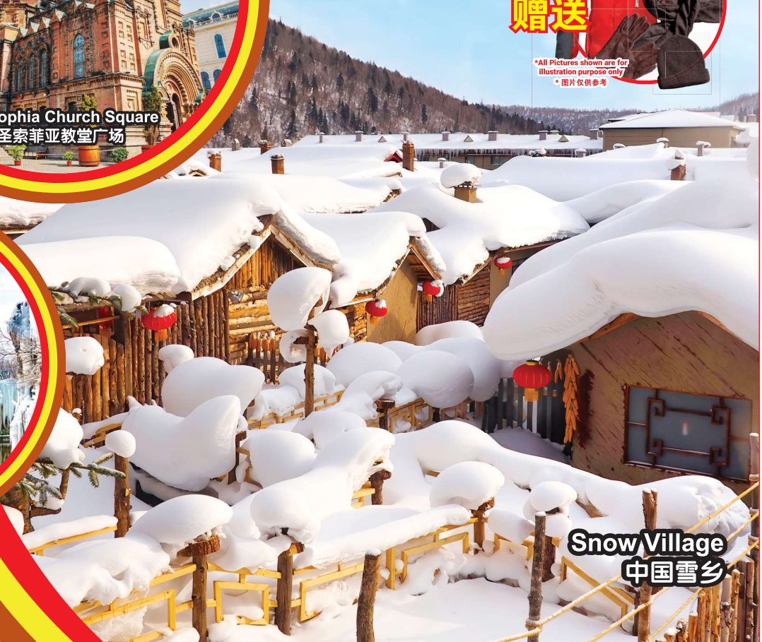
Snow Village 中国雪乡

行程次序·以当地旅社安排为准。 Sequences of Itinerary are subject to local arrangement.