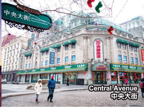
Central Avenue 中央大街