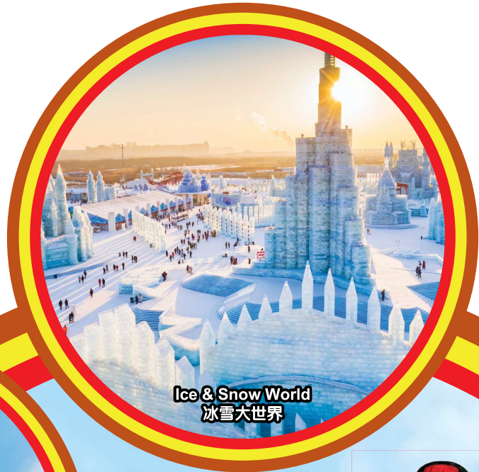
Ice & Snow World 冰雪大世界