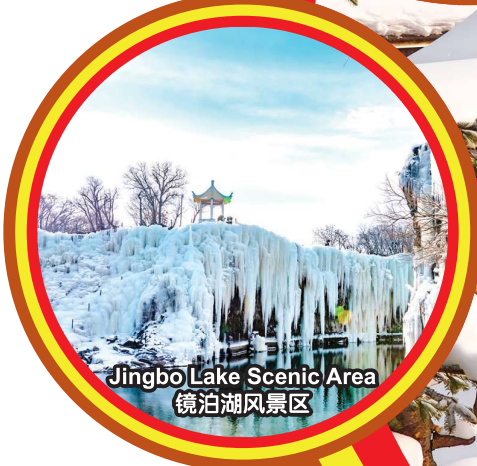
Jingbo Lake Scenic Area 镜泊湖风景区

*All Pictures shown are for illustration purpose only *图片仅供参考