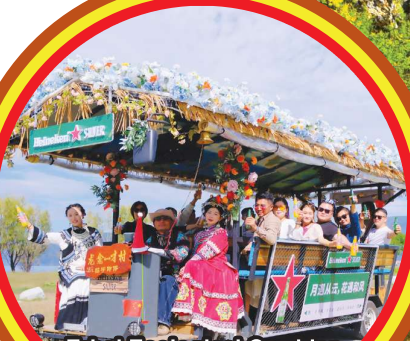
Erhai Ecological Corridor 洱海生态廊道