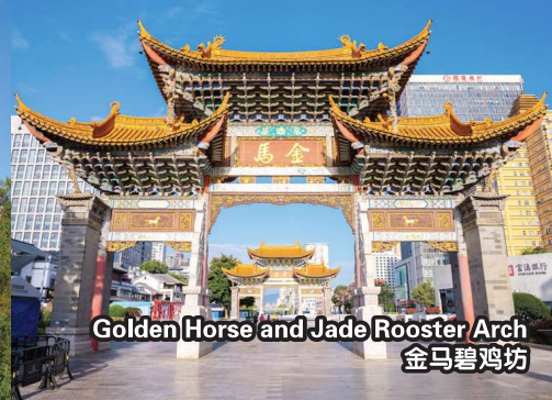
Golden Horse and Jade Rooster Arch 金马碧鸡坊