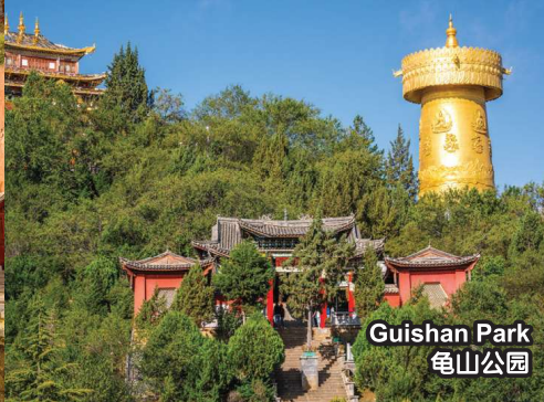
Guishan Park 龟山公园