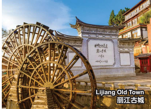
Lijiang Old Town 丽江古城