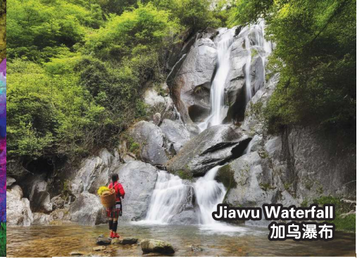
Jiawu Waterfall 加乌瀑布