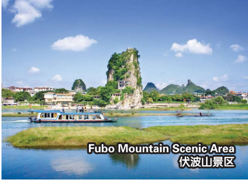
Fubo Mountain Scenic Area 伏波山景区