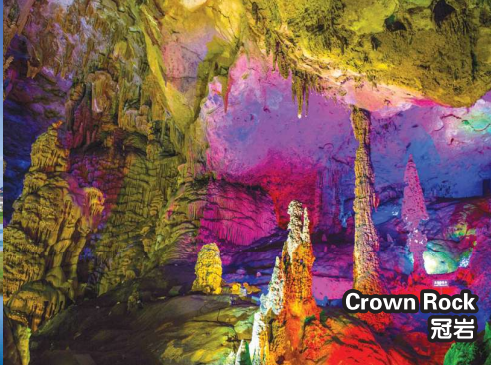
Crown Rock 冠岩