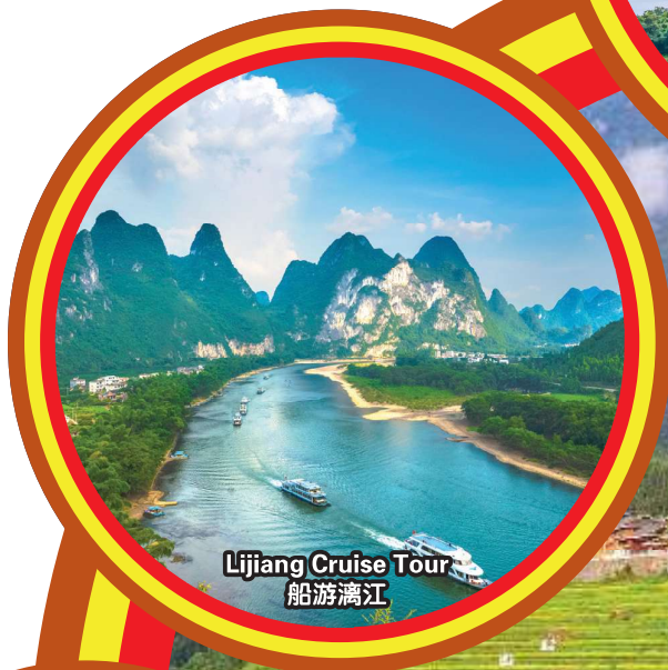
Lijiang Cruise Tour 船游漓江