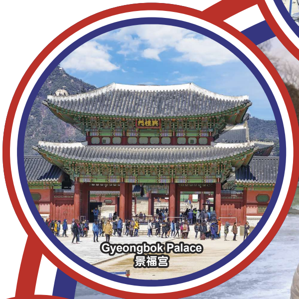
Gyeongbok Palace 景福宫