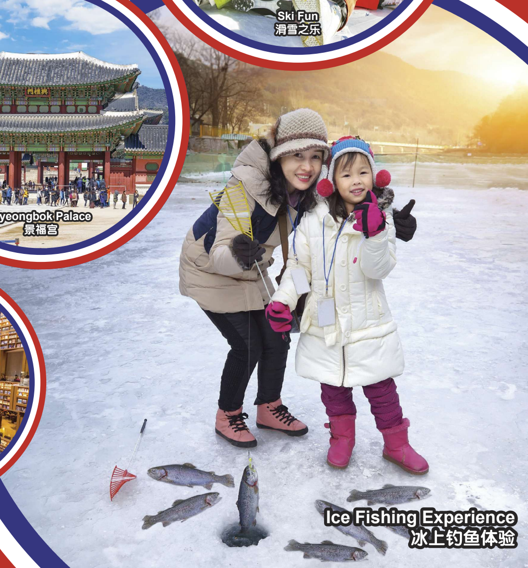
Ice Fishing Experience 冰上钓鱼体验

行程次序，以当地旅社安排为准。 Sequences of Itinerary are subject to local arrangement.