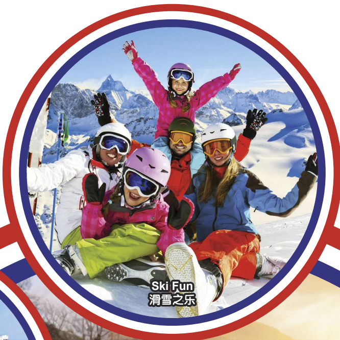
Ski Fun 滑雪之乐