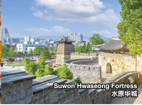
Suwon Hwaseong Fortress 水原华城