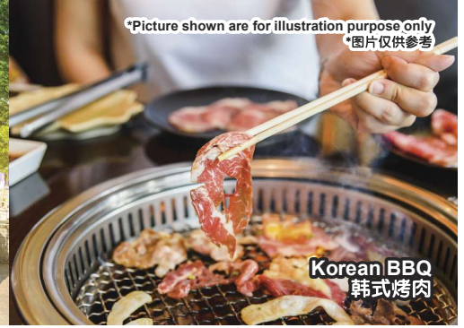
Korean BBQ 韩式烤肉

*Picture shown are for illustration purpose only *图片仅供参考