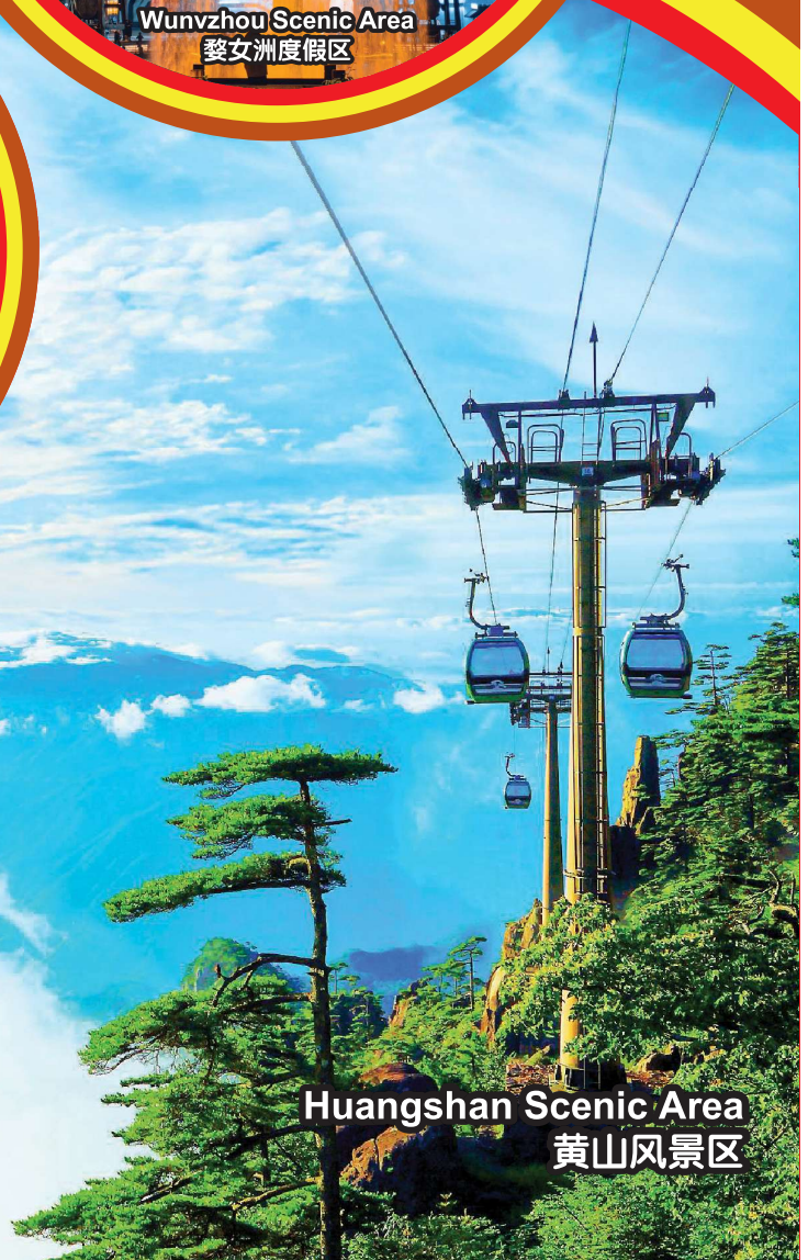
Huangshan Scenic Area 黄山风景区