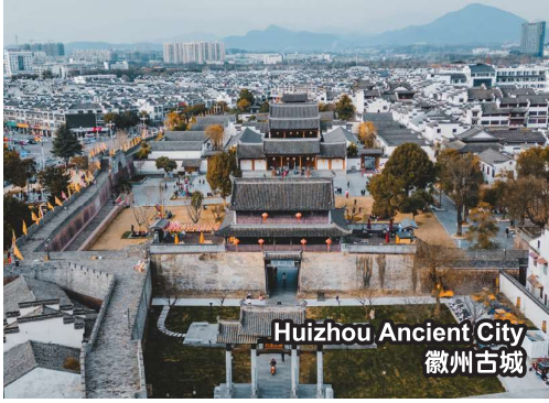
Huizhou Ancient City 徽州古城

*Picture shown are for illustration purpose only *图片仅供参考