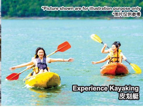
Experience Kayaking 皮划艇