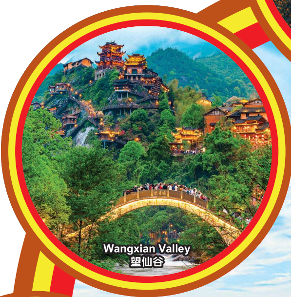
Wangxian Valley 望仙谷