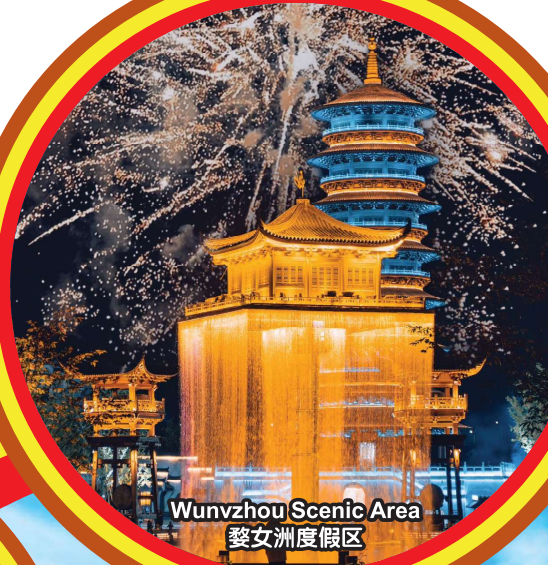
Wunvzhou Scenic Area 婺女洲度假区