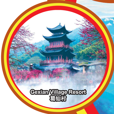
Gexian Village Resort 葛仙村